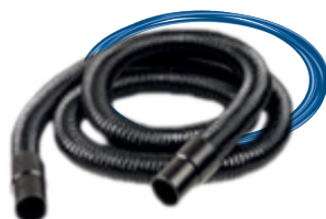
1 Шланг 5 м | Ø 29 мм