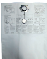
1 Мешок для пыли (арт. 058880 - 5 мешков)